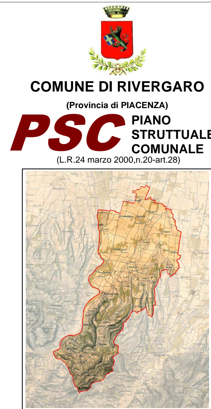
TAVOLA DEI VINCOLI TAV. 1a.1 Tutele e vincoli di natura ambientale, unità di paesaggio Scala 1:5.000

ADOZIONE: Del. C.C. n.27 del 29/06/2016 APPROVAZIONE: Del. C.C. n. 14 del 29/03/2019